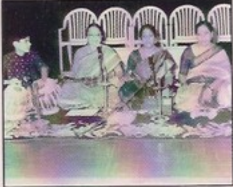
ಮೈಸೂರು ಅಸೋಸಿಯೇಶನ್ ಲಲಿತ ಕಲಾವಿಭಾಗದವರು ವಚನಗಳನ್ನು ಹಾಡುತ್ತಿರುವುದು.