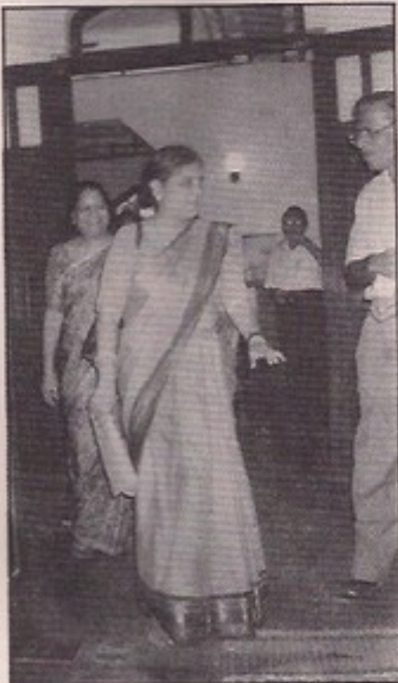
ಶ್ರೀಮತಿ ಸುಧಾಮೂರ್ತಿಯವರು ಅಸೋಸಿಯೇಷನ್‌ನ ಎಂಥ ಭಾಗಗಳನ್ನು ನೋಡುತ್ತಿರುವುದು.