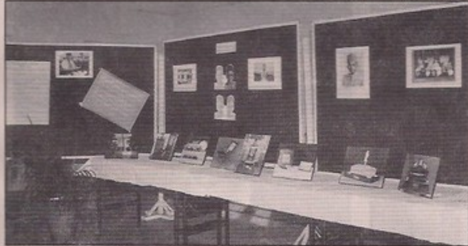
ಮಾಸ್ತಿ ಯವರ ಬಗ್ಗೆ ವಿವರಿಸಿದ್ದ ಪ್ರವರ್ತನದ ಒಂದು ನೋಟ.