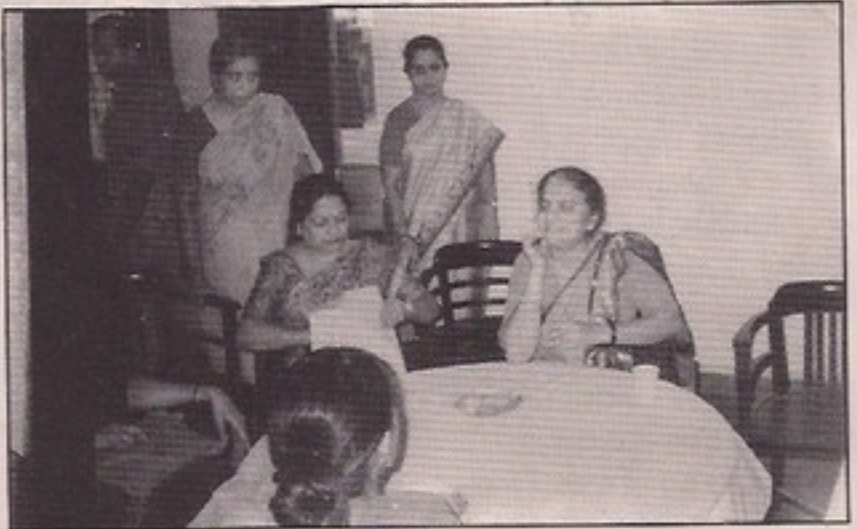
ಶ್ರೀಮತಿ ಸುಧಾ ಮೂರ್ತಿಯವರು ಸದಸ್ಯರೊಂದಿಗೆ ಮಾತನಾಡುತ್ತಿರುವುದು.

ಜಾಲ್ಮದಿಂದಲೂ ಇವರಿಗೆ ವಿದ್ಯೆಗೆ ಒಳ್ಳೆಯ ಪ್ರೋತ್ಸಾಹ ದೊರೆತಿದೆ, ಮದುವೆಯಾದ ನಂತರ ಪತಿಯ ಪ್ರೋತ್ಸಾಹ, 'ಇನ್‌ಫೋಸಿಸ್' ಸಂಸ್ಥೆಯನ್ನು ಹುಟ್ಟು ಹಾಕಿದ 'ಸಾಪ್ಟ್‌ವೇರ್' ಕ್ಷೇತ್ರದಲ್ಲಿ ಪ್ಯಾತ ಇಂಜಿನಿಯರ್ ಆಗಿರುವ 'ಶ್ರೀನಾರಾಯಣ ಮೂರ್ತಿ'ಯವರು ಇವರ ಪತಿ. ಸುಧಾ ಅವರಿಗೆ ಸಾಹಿತ್ಯದಲ್ಲಿ ಬಹಳ ಆಸಕ್ತಿ. ಶಾಸ್ತ್ರೀಯ ಗಾಯನದಲ್ಲಿಯೂ ಬಹಳ ಆಸಕ್ತಿ. ಅನೇಕ ಕಥೆಗಳನ್ನು ಬರೆದಿದ್ದಾರೆ. ಸಣ್ಣ ಕಥೆಗಳ ಮೂಲಕ