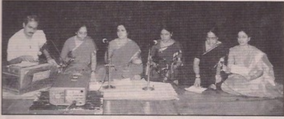
ಅನುಜಾ ಮಹಿಳಾ ಸಂಘವರಿಂದ "ಮಾಸ್ತಿ ಗುಂಜನ" ಕಾರ್ಯಕ್ರಮ