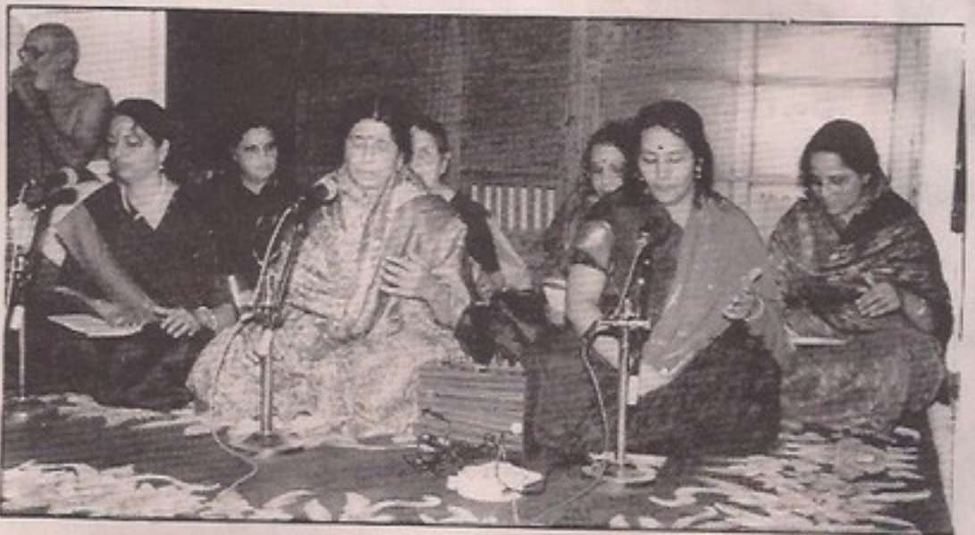
'ಸಿಂಧು ಭೈರವಿ' ತಂದವರಿಂದ ಭಕ್ತಿ ಗೀತೆ ಕಾರ್ಯಕ್ರಮ

ಪರಕಾಲ ಮಠದ ಆರಾಧ್ಯ ದೇವತೆ ಶ್ರೀ ಲಕ್ಷ್ಮೀ ಹಯಗ್ರೀವ. ಈ ಮಠದಲ್ಲಿ ಪ್ರತಿಷ್ಠೆಯಾಗಿರುವ ಶ್ರೀ ಲಕ್ಷ್ಮೀ ಹಯಗ್ರೀವ ವಿಗ್ರಹಕ್ಕೆ ಬಹಳ ಶ್ರೇಷ್ಠವಾದ ಇತಿಹಾಸವಿದೆ. ಶ್ರೀ ರಾಮಾನುಜಾಚಾರ್ಯರಿಗೆ, ಅವರ ಶ್ರೀ ಭಾಷ್ಯವನ್ನು