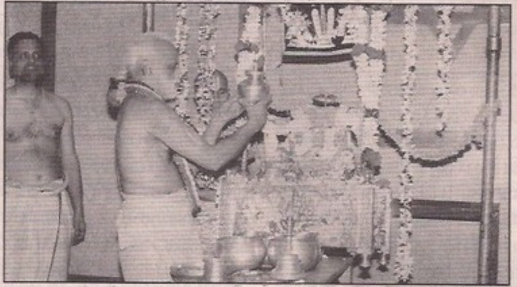
ಶ್ರೀ ಲಕ್ಷ್ಮೀ ಹಯಗ್ರೀವ ದೇವರಿಗೆ ಡೋಲಾಯ ಪೂಜೆ ನಡೆಸುತ್ತಿರುವುದು.

ಮೈಸೂರು ಅರಸರ ಆಶ್ರಯದಲ್ಲಿ ಪರಕಾಲ ಮಠವು ದೊಡ್ಡದಾಗಿ ಬೆಳೆಯಿತು. ಅನೇಕ