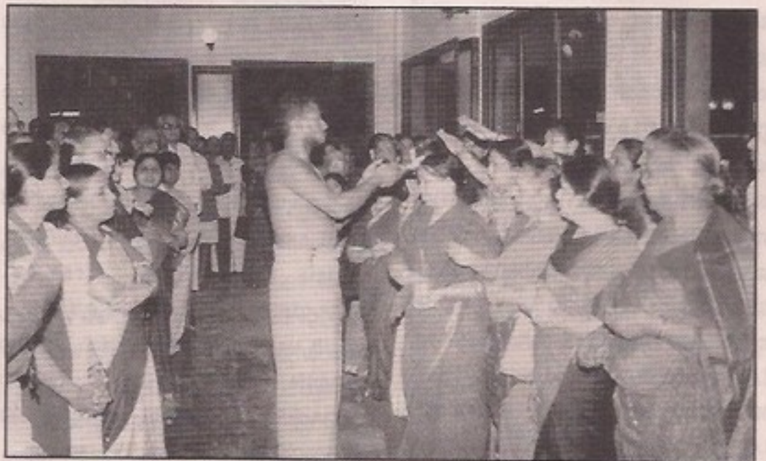
ನರದ ಭಕ್ತಾ ದಿಗುಲ ಮಂಗಳಾರತಿ ಸ್ವೀಕರಿಸುತ್ತಿರುವುದು.

ಅಂದಿನ ಸಂಜೆ ಸ್ವಾಮಿಗಳ ದರ್ಶನಕ್ಕೆ ಅನೇಕ ಸದಸ್ಯರು ಮತ್ತು ಅಸೋಸಿಯೇಷನ್ನಿನ ಹಿತೈಷಿಗಳೂ ಬಂದಿದ್ದರು. ಪರಕಾಲ ಮಠದಿಂದ ತಂದಿದ್ದ ಶ್ರೀ ಲಕ್ಷ್ಮೀ ಹಯಗ್ರೀವ ಮೂರ್ತಿಯ ಡೋಲಾಯ ಪೂಜೆಯಲ್ಲಿ ಪಾಲ್ಗೊಂಡರು ಮತ್ತು ಮಠದ ಕಾರ್ಯ ಯೋಜನೆಗಳಿಗೆ ತಮ್ಮ ಕಾಣಿಕೆಯನ್ನಿತ್ತರು. ಒಟ್ಟಿನಲ್ಲಿ ಅಂದಿನ ಸಂಜೆ ಸಂತೋಷ ಮತ್ತು ಸಂಭ್ರಮದಿಂದ ಕೂಡಿದ ಸಂಜೆಯಾಗಿತ್ತು.