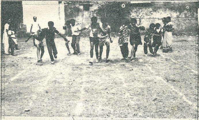
9 ವರ್ಷಕ್ಕೆ ಮೇಲ್ಕಟ್ಟು ಮಕ್ಕಳು ಮೂರು ಕಾಲಿನ ಸ್ಪರ್ಧೆಯಲ್ಲಿ ಕಾಲುಕಟ್ಟಿಕೊಂಡು ಓಡುತ್ತಿರುವುದು.