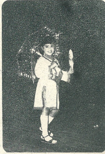
ವಿವಿಧ ವೇಷ ಸ್ಪರ್ಧೆಯಲ್ಲಿ

ಡಿಸೆಂಬರ್ 24 ರಂದು ಸುಮಾರು ಅಪರಾಹ್ನ 3-00 ಘಂಟೆಗೆ ಮಕ್ಕಳಿಗಾಗಿ ಚಿತ್ರಕಲಾ ಸ್ಪರ್ಧೆಯಿಂದ ಆರಂಭವಾದ ಪ್ರತಿಭಾಸ್ಪರ್ಧೆಯು ಸಂಜೆ ಸುಮಾರು 8-30 ರವರೆಗೆ ನಡೆಯಿತು. ಈ ಚಿತ್ರಕಲೆಯ ಸ್ಪರ್ಧೆಯಲ್ಲಿ 16 ಮಕ್ಕಳು ಭಾಗವಹಿಸಿದ್ದರು. ನಂತರದ ಕಾರ್ಯಕ್ರಮ ಮಕ್ಕಳಿಂದ ಫ್ಯಾನ್ಸಿಡ್ರೆಸ್, ಹಾಡುಗಾರಿಕೆ, ಭಾಷಣಗಳನ್ನೊಳಗೊಂಡಿದ್ದವು. ಎಲ್ಲ ಕಾರ್ಯಕ್ರಮಗಳಲ್ಲಿ 4 ವರ್ಷದಿಂದ 14 ವರ್ಷದೊಳಗಿನ ಮಕ್ಕಳು ಸ್ಪರ್ಧಿಸಿದ್ದರು. ಕಾರ್ಯಕ್ರಮವನ್ನು