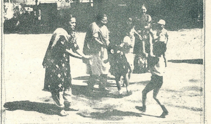
ವಾರ್ಷಿಕ ಕ್ರೀಡಾಕೂಟದಲ್ಲಿ 6 ವರ್ಷದೊಳಗಿನ ಮಕ್ಕಳು ಬಿಸ್ಕೆಟ್ ತಿನ್ನುವ ಸ್ಪರ್ಧೆಯಲ್ಲಿ ಭಾಗವಹಿಸುತ್ತಿರುವುದು