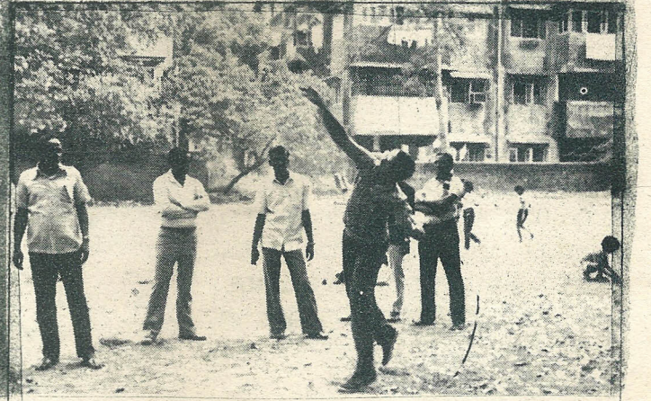
ಪುರುಷರ 'ಶಾಟ್ ಪುಟ್' ಎಸೆತ.