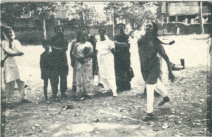
ಮಹಿಳೆಯರ 'ಶಾಟ್ ಪುಟ್' ಎಸೆತ.

ಡಿಸೆಂಬರ್ 25 ರಂದು ಕ್ರೀಡಾಕೂಟದಲ್ಲಿ ಮಕ್ಕಳು ಯುವಕರು ಹಾಗೂ ವಯಸ್ಕರು ಭಾಗವಹಿಸಿದ್ದರು. ಮಕ್ಕಳಿಗೆ ವೇಗದ ಓಟ, ಮೂರುಕಾಲಿನ ಓಟ, ಗೋಲಿ-ಚಮಚ, ಚಿಂಡು ಎಸೆತ, ಪೊಟ್ಟಾಟೋ ರೇಸ್, ಏಮ್ಮಿಂಗ್ ದಿ ವಿಕೆಟ್ ಇತ್ಯಾದಿ ಸ್ಪರ್ಧೆಗಳಿದ್ದವು. ಗಂಡಸರು ಮತ್ತು ಹೆಂಗಸರು ಶಾಟ್‌ಪುಟ್ ಎಸೆತ, ಬಾಸ್ಕೆಟ್ ಬಾಲ್ ಎಸೆತ, ಇತ್ಯಾದಿ ಸ್ಪರ್ಧೆಗಳಲ್ಲಿ ಭಾಗವಹಿಸಿದ್ದರು. ಕಾರ್ಯಕ್ರಮಕ್ಕೆ ಹಲವಾರು ಜನರು ಬಂದು ನಡೆಸಿಕೊಟ್ಟರು. ಮ್ಯೂಸಿಕಲ್ ಚಿರ್‌ನಿಂದ ಕಾರ್ಯಕ್ರಮ ಕೊನೆಗೊಂಡಿತು.