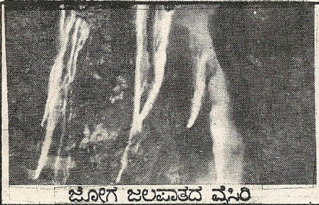
ಜೋಗ ಜಲಪಾತದ ವಿಸಿರಿ

ಉತ್ತರ ಕನ್ನಡ ಜಿಲ್ಲೆಯ ಇನ್ನೊಂದು ರಮಣೀಯ ಜಲಪಾತ ಲಾಲ್ಕುಳಿ ಜಲಪಾತ. ಯಲ್ಲಾಪುರದಿಂದ 20 ಕಿ.ಮೀ. ಲಾಲ್ಕುಳಿ ಗ್ರಾಮವಿದೆ. ಲಾಲ್ಕುಳಿಯಿಂದ ಉತ್ತರಕ್ಕೆ ಐದಾರು ಕಿ.ಮೀ. ಕ್ರಮಿಸಿದರೆ ಕಾಳಿ ನದಿ ಪ್ರತ್ಯಕ್ಷವಾಗುತ್ತದೆ. ಅತಿರದ್ರ ರಮಣೀಯ ಅರಣ್ಯ ದಿಂದಾವತ್ತವಾದ ಕಾಳಿಯು ಅನತಿ ದೂರದಲ್ಲಿ ಧುಮುಕಿ ಇಳಿಯುತ್ತಿರುವುದು ಕಂಡು ಬರುತ್ತದೆ. ಇಲ್ಲಿ ಕಾಳಿ ನದಿ ಅನೇಕ ಹಂತಗಳಲ್ಲಿ ಒಟ್ಟು 91 ಮೀಟರ್ ಎತ್ತರದಿಂದ ಮಾಲಾಜಲಪಾತವಾಗಿ ಹತ್ತಿರದ ಹನ್ನೆರಡು ಅಡಿ ಅಂತರದಲ್ಲಿ ಧುಮುಕುತ್ತದೆ. ಪ್ರತಿಯೊಂದು ಜಲಪಾತದ ತಳದಲ್ಲಿ ಹೊಂಡಗಳಿವೆ. 'ಲಾಲ್ಕುಳಿ' ಜಲಪಾತವೆಂದು ಹೆಸರಾದ ಈ ಸ್ಥಳಕ್ಕೆ ಬರುವುದು ಒಂದು ದುಸ್ಸಾಹಸ ಮಾಡಿದಂತೆಯೇ ಮೇಲೆ ಸುಮಾರು 10 ಕಿ.ಮೀ. ದೂರದಲ್ಲಿ ವಿದ್ಯುಚ್ಛಕ್ತಿ ನಿರ್ಮಾಣಕ್ಕೆಂದು ತಡೆದು ನಿಲ್ಲಿಸಿರುವುದರಿಂದ ಕಾಳಿನದಿ ಇಲ್ಲಿ ಸೊರಗಿದೆ. ಲಾಲ್ಕುಳಿ ಜಲಪಾತ ದಾಂಡೇಲಿಗೆ ಹತ್ತಿರವಿದ್ದು ಜಲಪಾತ ನೋಡಲು ಹೋಗುವವರು ದಾಂಡೇಲಿಯ ವನ್ಯಪ್ರಾಣಿ ಅಭಯಾರಣ್ಯವನ್ನೂ ಸಂದರ್ಶಿಸಬಹುದು.