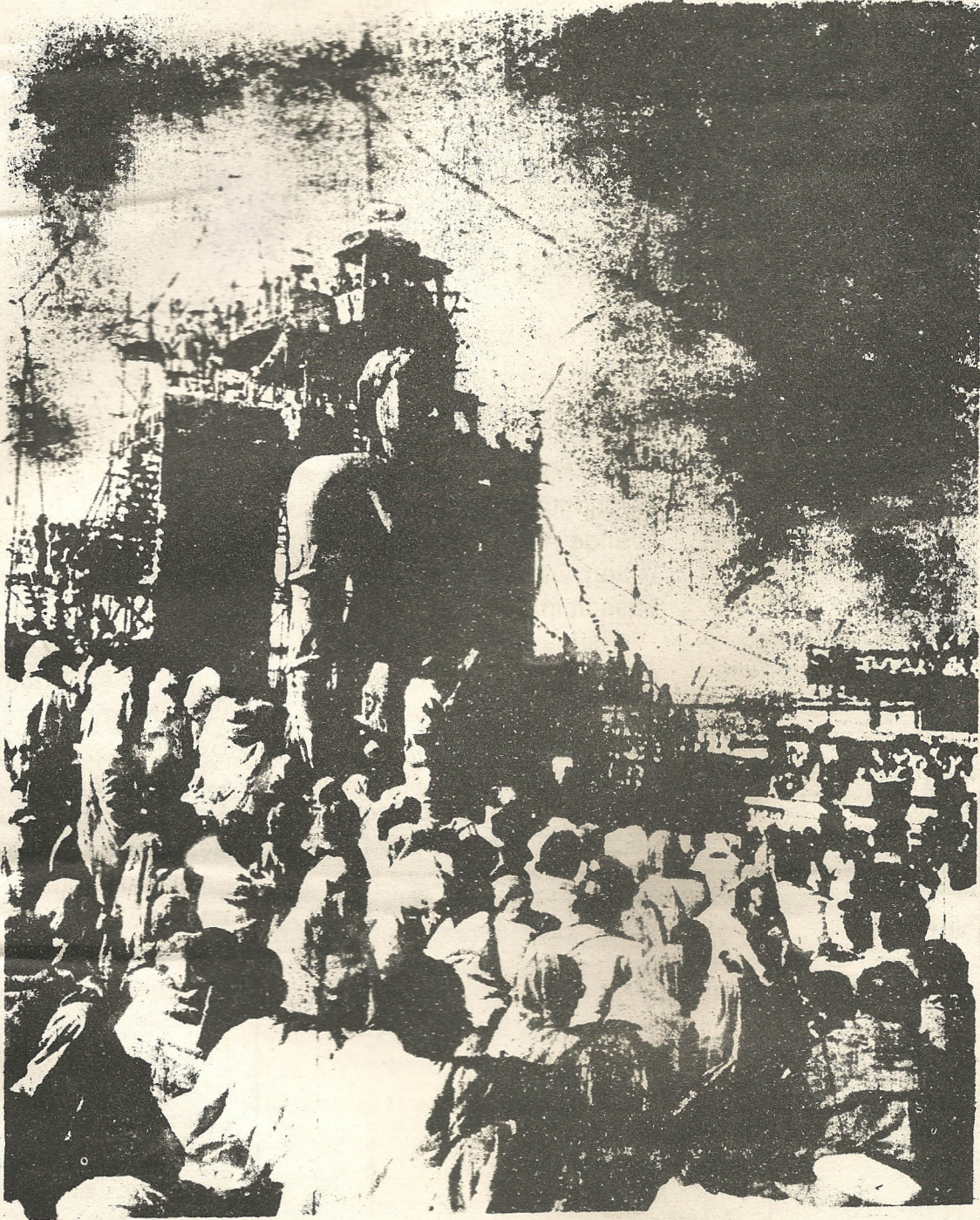
THE MAHAMASTAKABHISEKA AT SRAVANABELAGOLA