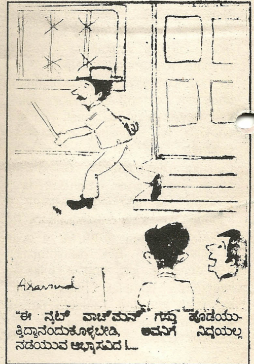
"ಈ ನಟಿ" ವಾಚಮನ್ ಗದ್ದು ತೊಡೆಯು- ತಿದ್ದಾನೆಂದುಕೊಳ್ಳಬೇಡಿ, ಅವನಿಗೆ ನಿಧಿಯಲ್ಲ ನಡೆಯುವ ಅಭ್ಯಾಸವಿದೆ L