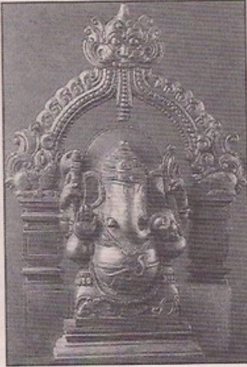
GANAPATI 130 x 190 mm - Brass (Oxidised)