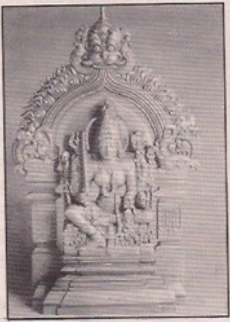
ಬೆಳಗಾವಿ ಜಿಲ್ಲೆಯ ಶಿರಸಂಗಿಯಲ್ಲಿರುವ ಮಹಾಕಾಳಿ ದೇವಿಯ ಮೂರ್ತಿಯ ಲೋಹದ ಪ್ರಕೃತಿ

ಇವರು ತಮ್ಮ 18ನೆಯ ವಯಸ್ಸಿನಲ್ಲಿ ದೇಶಾದ್ಯಂತ ಹರಡಿದ್ದ ಸಂಗ್ರಾಮದಲ್ಲಿ ವಿದ್ಯಾರ್ಥಿಯಾಗಿದ್ದಾಗಲೇ ಚಟುವಟಿಕೆಯಲ್ಲಿ ತೊಡಗಿದ್ದು, ಪೋಲೀಸರ ಕಣ್ಣು ತಪ್ಪಿಸಲು ಮುಂಬೈಗೆ