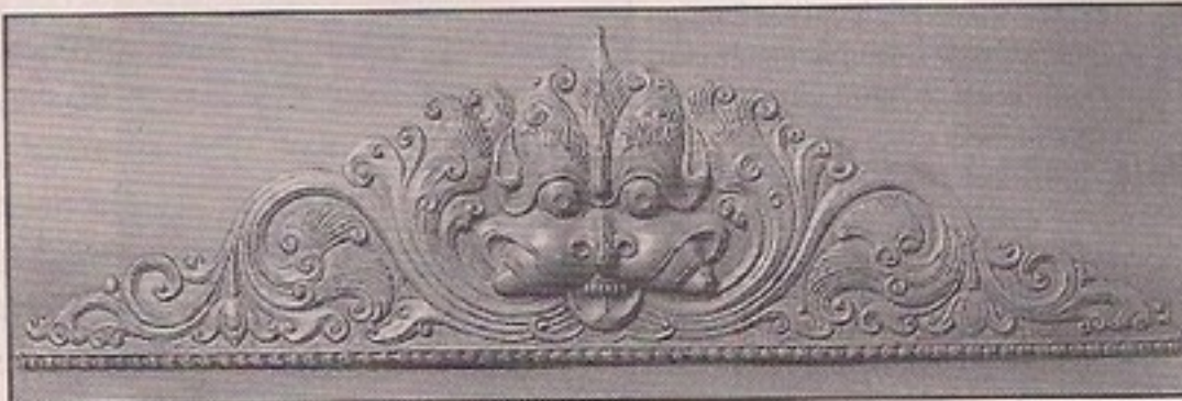
KIRTI MUKH (Repousse) 200 x 640 mm Copper

ಗಳನ್ನು ಇತರ ಶಾಸ್ತ್ರಗ್ರಂಥಗಳನ್ನೂ, ಪಾಶ್ಚಾತ್ಯ ಸಾಹಿತ್ಯವನ್ನೂ ತಾವೇ ಸ್ವತಂತ್ರವಾಗಿ ಅಭ್ಯಾಸ ಮಾಡಿರುತ್ತಾರೆ.