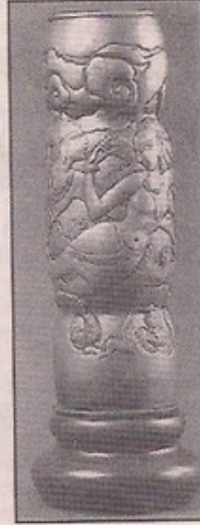
VASE Copper with Wooden Padastal