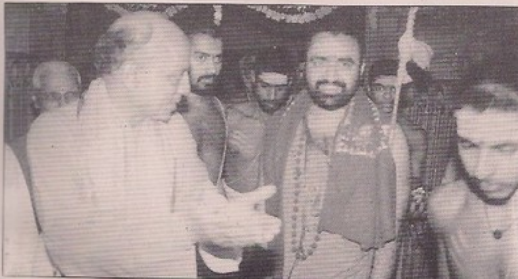
ಶ್ರೀ ಕಂಚಿಕಾಮಕೋಟಿ ಪೀಠದ ಕಿರಿಯ ಸ್ವಾಮಿಗಳಾದ ಶ್ರೀ ಶಂಕರ ವಿಜಯೇಂದ್ರ ಸ್ವಾಮಿಗಳು ವಿಜಯಗೃಹಿಯಲ್ಲಿರುವುದು.

ಕಾಂತೀಪುರದಲ್ಲಿ ನೆಲೆಸಿ ಅಲ್ಲಿಯೇ ತಮ್ಮ ನತ್ವರ ಶರೀರವನ್ನು ತ್ಯಜಿಸಿದರು. ಬ್ರಾಹ್ಮಣ್ಯವನ್ನು ಎತ್ತಿ ಹಿಡಿದ ಕೀರ್ತಿ ಅವರದು. ಕಾಶ್ಮೀರದಿಂದ ಕನ್ಯಾ ಕುಮಾರಿಯ ವರೆಗೂ ಅವರ ಕೀರ್ತಿ ಹರಡಿದೆ.