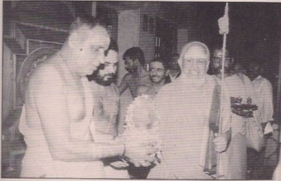
ಶ್ರೀ ಕಂಚಿಕಾಮಕೋಟಿ ಪೀಠದ ಹಿರಿಯ ಸ್ವಾಮಿಗಳಾದ ಶ್ರೀ ಜಯೇಂದ್ರ ಸರಸ್ವತಿಯವರನ್ನು ಪೂರ್ಣಕುಂಭದೊಂದಿಗೆ ಸ್ವಾಗತಿಸುತ್ತಿರುವುದು.

ಕಂಚಿಕಾಮ ಕೋಟಿ ಪೀಠದ ಇತಿಹಾಸವು ಬಹಳ ಪುರಾತನವಾದದ್ದು. ಸುಮಾರು 2000 ವರ್ಷಗಳು ಹಿಂದೆ ಶ್ರೀ ಶಂಕರಚಾರ್ಯರು ಭಾರತದಲ್ಲಿ ಸನಾತನ ಧರ್ಮವನ್ನು ಪ್ರತಿಷ್ಠಾಪಿಸಿದರು. ದುರಾಚಾರ ಹಿಂಸೆ, ವ್ಯಮನಸ್ಸುಗಳಲ್ಲಿ ತೊಳಲುತ್ತಿದ್ದ ಜನರಿಗೆ ವೇದ ಮಾರ್ಗದ ಸೃಷ್ಟಿ ಸ್ಮರಣಪಗಳಾದ ಸತ್ಯ, ಧಾನ, ದಯೆ ಹಾಗೂ ತಪದ ಮಾರ್ಗಗಳನ್ನು ಬದರಿನಾಥ, ಜಗನ್ನಾಥಪುರಿ ಹಾಗೂ ದಕ್ಷಿಣದ ಶಂಗೆರಿಯಲ್ಲಿ ನಾಲ್ಕು ಮಠಗಳನ್ನು ಸ್ಥಾಪಿಸಿದರು. ತಾವು ಸ್ವತಃ