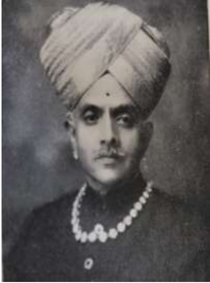
Our First Patron H. H. Col. Sir Sri Krishnarajendra Wadayar Bahadur, G.C.S.I. G.B.E. Maharaja of Mysore