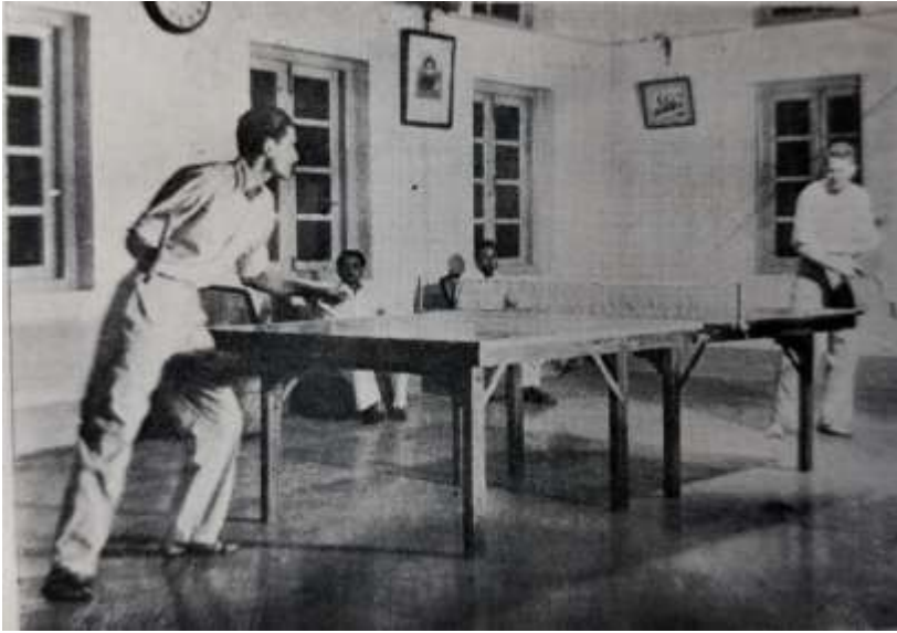
OURS IS THE UNIQUE MAJOR RANKING TOURNAMENT OF O.T.T. IN NORTH BOMBAY

view to implement the objects, for the fostering and promotion of which this Institution came into being.