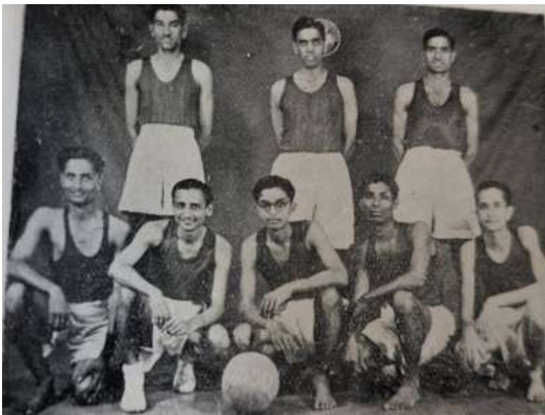
THE BASKET BALL - THE MOST POPULAR OUTDOOR GAME OF THE ASSOCIATION, "BOMBAY PROVISIONAL CHAMPIONS 1949, 1950 & 1951

Our efforts in getting an open space to start some outdoor games bore fruit in the year, 1938. We are thankful to the Bombay Municipal Corporation for permitting us to use the playground at the back of the Association.