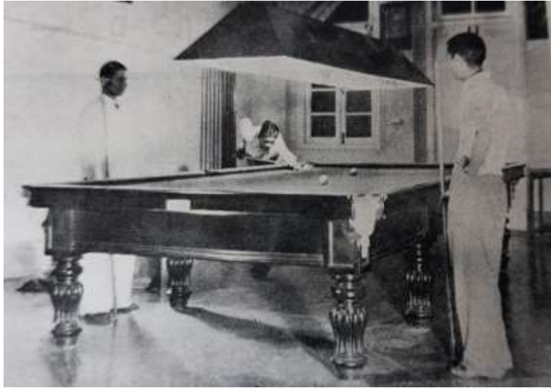
THE BEST BILLIARDS TABLE IN MATUNGA WITH THE CHAMPION PROFESSIONAL COACH

Table Tennis, and field sports became gradually a regular feature, well contested and handsomely rewarded. With the addition of the second floor, the main hall of the Association was placed entirely at the disposal of the Table Tennis fans and the influx of many younger and enthusiastic members witnessed in later years, necessitated the provision of an additional Table. The Section is grateful to Sri N.