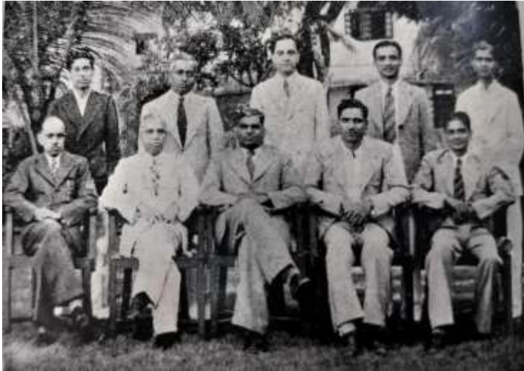
Managaing Committee for 1950-51

cradles and the fond hope of housing the Institution in its own building did not materialise till 1936.