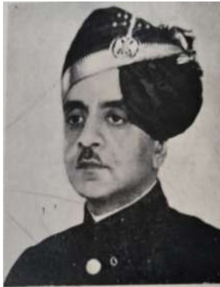
Distinguished Visitor - H. H. Sir Sri Kantiraya Narasimharaja Wadayar Bahadur, G.C.I.E. Yuvaraja of Mysore

sufficient sum to put up a collapsible wooden partition in the main hall, for providing a Ladies Room with necessary equipment was donated.