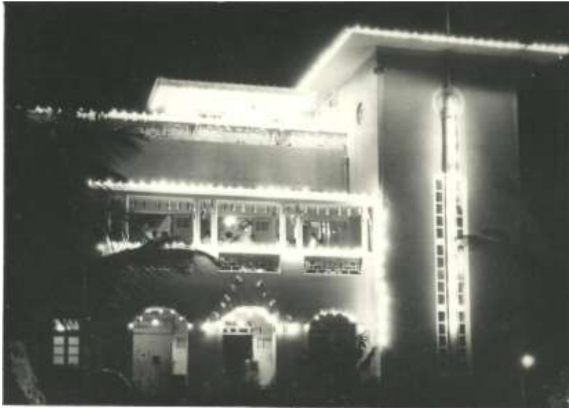
Association Building (1934)

1951 is a year of Rejoicing and Remembrance for us Mysoreans in Bombay. It is not just one another year passed but the fruition of the ceaseless and devoted work of hundreds of selfless Men and Women. And We are proud of it. In the history and growth of any Institution, it is in the first Twenty-five years that many hurdles