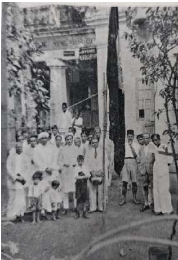
Patron's Birthday Celebration