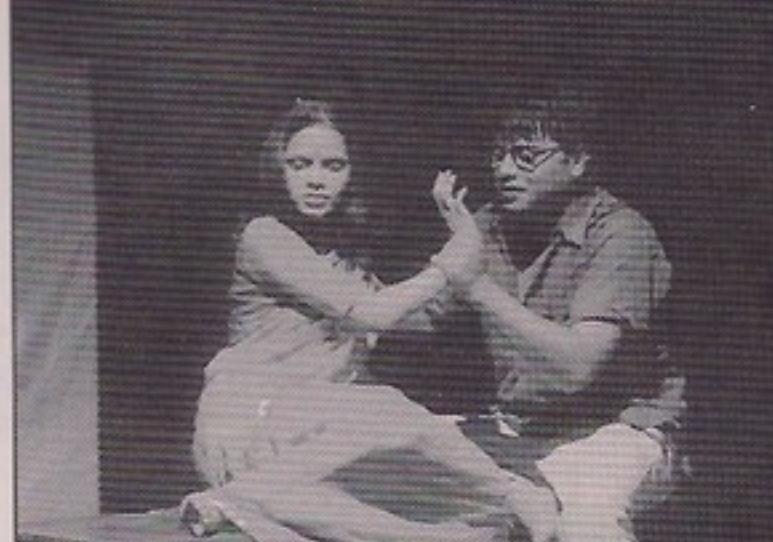
D.G. Ruparel College - DHARMAPUTRA