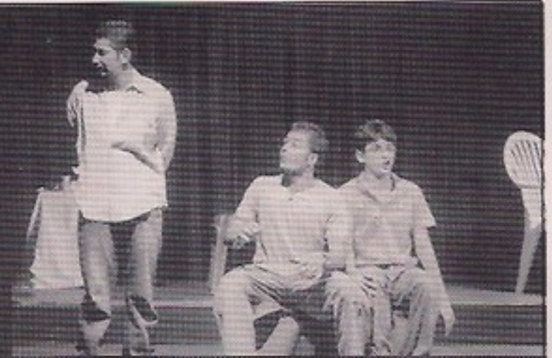
U.P.G. College of Management - KASTURI