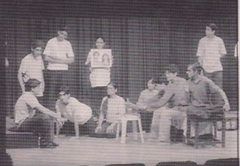
P. D. Lions College - GHARONDA