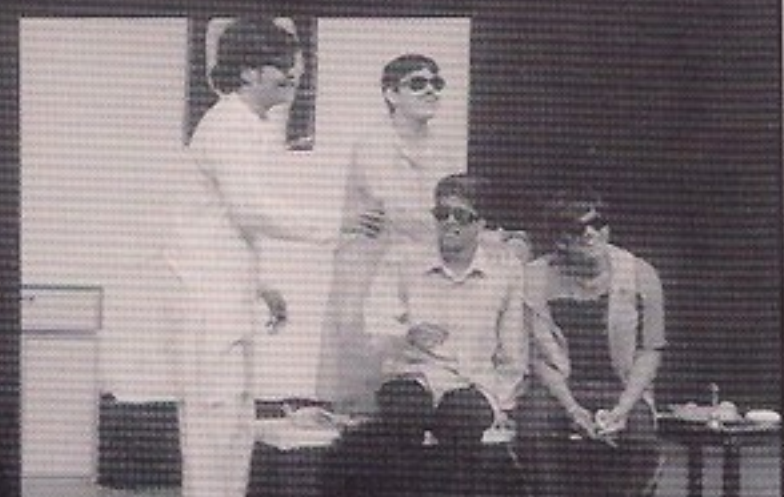
Mithibai College - TAX FREE