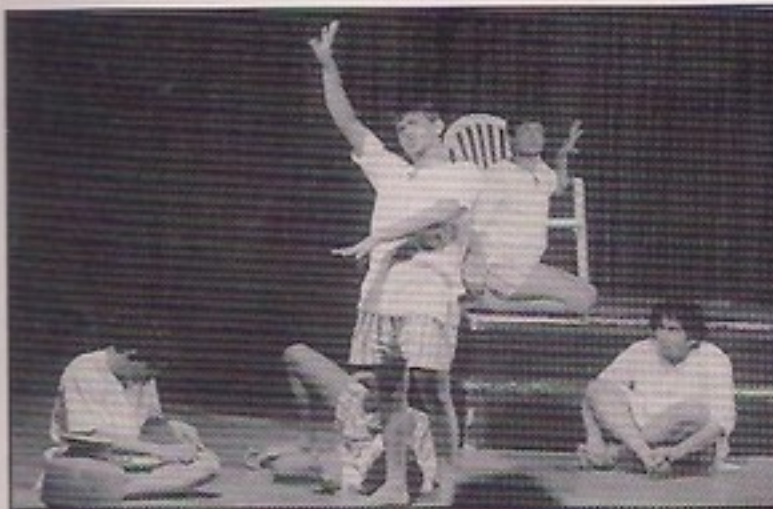
Sathaye Collage - WE THE PEOPLE