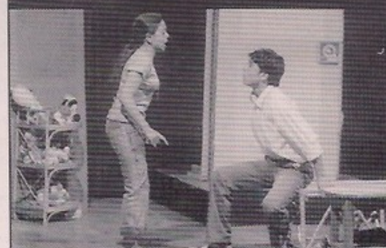
G. N. Khalsa College - JO ROZ MAREN