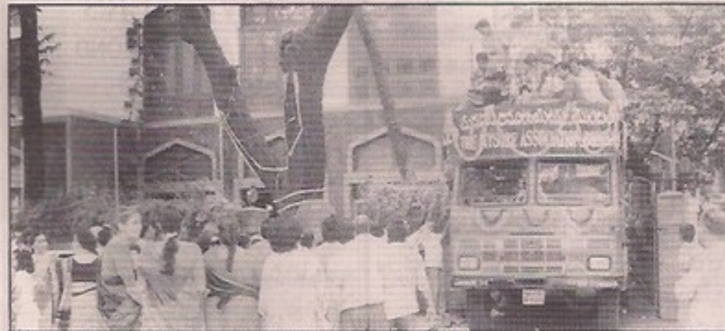
ಗೌರಮ್ಮ ಹಾಗೂ ಗಣಪತಿಯನ್ನು ಮೆರವಣಿಗೆಯಲ್ಲಿ ವಿಸರ್ಜನೆಗೆ ಕರೆದೊಯ್ಯುತ್ತಿರುವುದು.