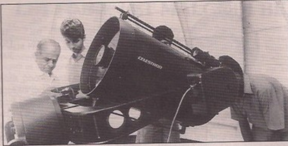
Telescope in Observatory

the President of the Order, joined the order in Mysore and spent nine years there.