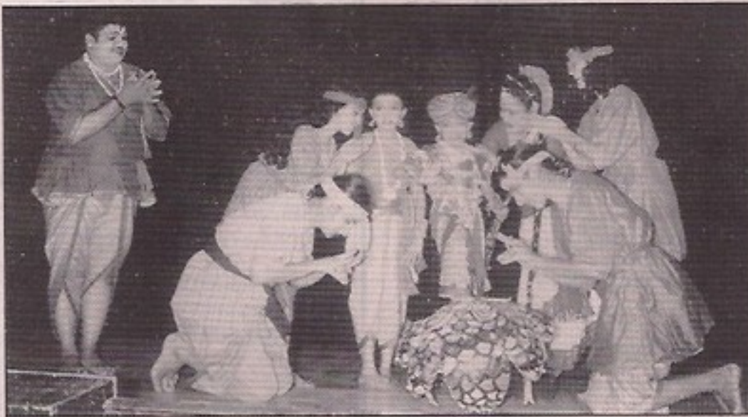
ಕಾಳಿಂಗ ಮರ್ದನದ ದೃಶ್ಯ.

ಮಲಗಿಸಿರಲು 'ನಿನ್ನನ್ನು ಕೊಂದು ಕಂಸನ ಮೃತ್ಯುವನ್ನು ಗೆದ್ದು, ನಾ ನಗುವೆ ಎಂದು ರಾಕ್ಷಿಸಿ ಪೂತನಿಯು ಸುಂದರಿಯಂತೆ ವೇಷಧರಿಸಿ ಬರುತ್ತಾಳೆ. ಆದರೆ ಕೃಷ್ಣ ಅರಿಯನೆ ಇವಳ ಮಾಯೆಯನ್ನು, ತನ್ನ ಬಾಲಲೀಲೆಯಿಂದ ಇವಳನ್ನು ಸಂಹರಿಸುತ್ತಾನೆ. ತ್ರಿಲೋಕ ಸಂಚಾರಿ ನಾರದ 'ನಾರಾಯಣನಳಿನೋದರ... ಎಂದು ಹಾಡುತ್ತಾ ಯಮುನಾ ತೀರಕ್ಕೆ ಬಂದಾಗಲಲ್ಲಿ ಕೃಷ್ಣನ ಸಖಿಯರನ್ನು ನೋಡಿ 'ಏನಿದೇನಿದು ಸುರನಾರಿಯರು ಯಮುನಾ ತೀರಕ್ಕೆ ಬಂದಿದ್ದೇಕೆ' ಎನ್ನಲು 'ನಂದನ ಭಾಗ್ಯವ ಯಶೋಧೆಯ ಸುಕೃತವ ಕಕ್ಕಾರ ಕಾಣೆ ಸುಖಿಸಲು' ಎನ್ನುತ್ತಾರೆ. ಶ್ರೀ ಕೃಷ್ಣ ಪರಮಾತ್ಮನನ್ನೇ ಮಗನಾಗಿ ಪಡೆದ ಯಶೋಧೆಯ ಪೂಜೆಯನ್ನು ಕೊಂಡಾಡುತ್ತಾರೆ. 'ಜಗವನೆತ್ತಿದವನ ಮಗುವಿನಂತೆ ತ್ತುವಳಂತೆ'.... ನಂತರ ಗೊಲ್ಲ ಬಾಲಕರೊಡಗೂಡಿ ಗೊಲ್ಲತಿಯರ ಮನೆಯ ಬೆಣ್ಣೆ ಕದಿಯುವುದು, ಗೊಲ್ಲತಿಯರು ಯಶೋಧೆಗೆ ದೂರು ಹೇಳುವ ದೃಶ್ಯ. ತಾಯಿ ವಾತ್ಸಲ್ಯ ಈ ದೂರುಗಳನ್ನು ನಂಬುತ್ತಾಳೆಯೇ? 'ಏಕೆ ದೂರುತ್ತೀರಾ ಮುದ್ದು ರಂಗಯ್ಯನ' ಎನ್ನು ತ್ತಾಳೆ. ನಂತರ ಕಾಳಿಂಗನ ವಧೆ 'ದುಷ್ಪ ನಿಗ್ರಹ ಶಿಷ್ಯ ರಕ್ಷಣ' ಇದೇ ಕೃಷ್ಣಾವತಾರದ ಧ್ಯೇಯ. ಪುರಂದರ ದಾಸರ ಒಂದು ಕೃತಿಯಲ್ಲಿ 'ಫಣಿಯ ಮೆಟ್ಟಿ ಬಾಲವ ಕೈಯಲ್ಲಿ ಹಿಡಿದು..... ದುಷ್ಪ ಕಾಳಿಂಗನ ಮೆಟ್ಟಿ ಭರದಿಂದ ಪುಟ್ಟಿ ಪಾದವನ್ನಿಟ್ಟು ಶ್ರೀಕೃಷ್ಣನು' ಎನ್ನುವಂತೆ. ಪ್ರಭಾತ್ ತಂಡದ ಕೃಷ್ಣನ ಪಾತ್ರಧಾರಿ ತನ್ನ