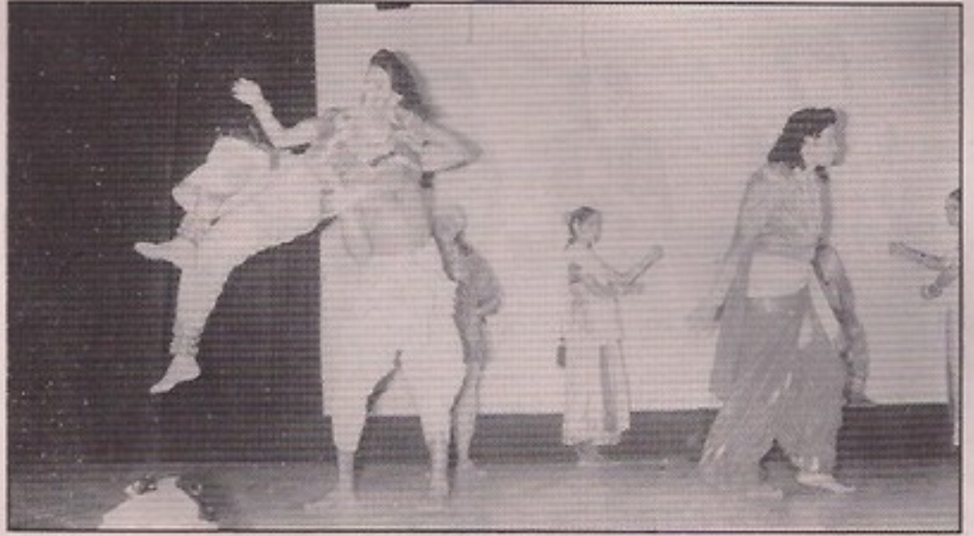
ಕಂಸ ಸಭೆಯಲ್ಲಿ ಮುಷ್ಠಿ ಯುದ್ಧ

ನಾಟಕ, ಏಕಾಂಕಗಳು ಹಾಗೂ ಹಾಡುಗಾರಿಕೆಗಳ ಮೂಲಕ ಜನಗಳ ಮೆಚ್ಚುಗೆಯನ್ನು ಪಡೆದಿದ್ದಾರೆ